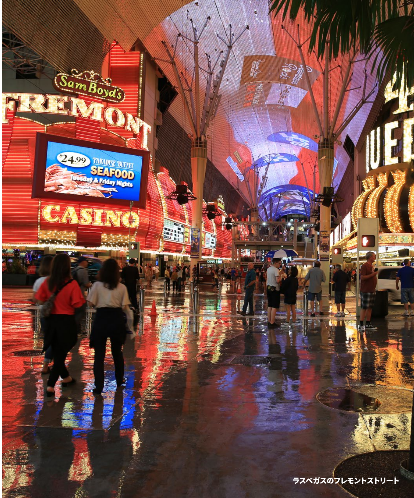
ラスベガスのフレモントストリート