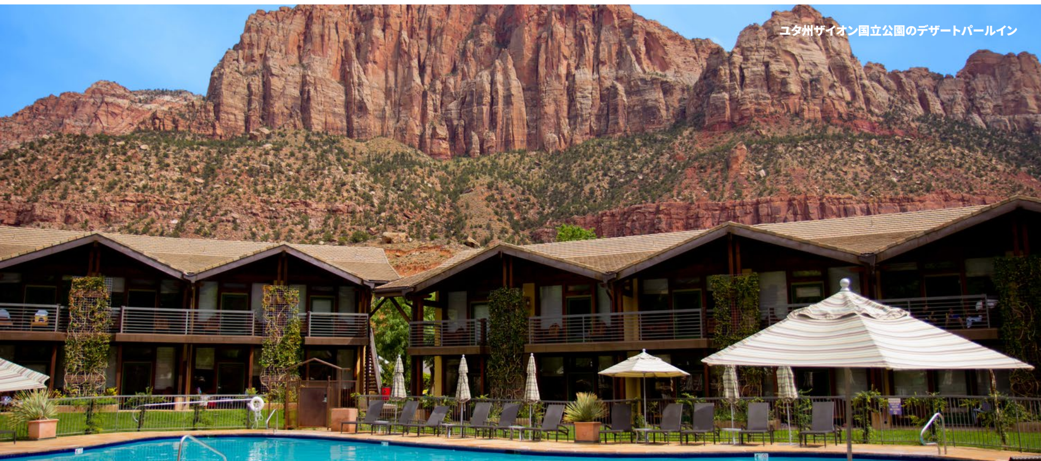
ユタ州ザイオン国立公園のデザートパールイン