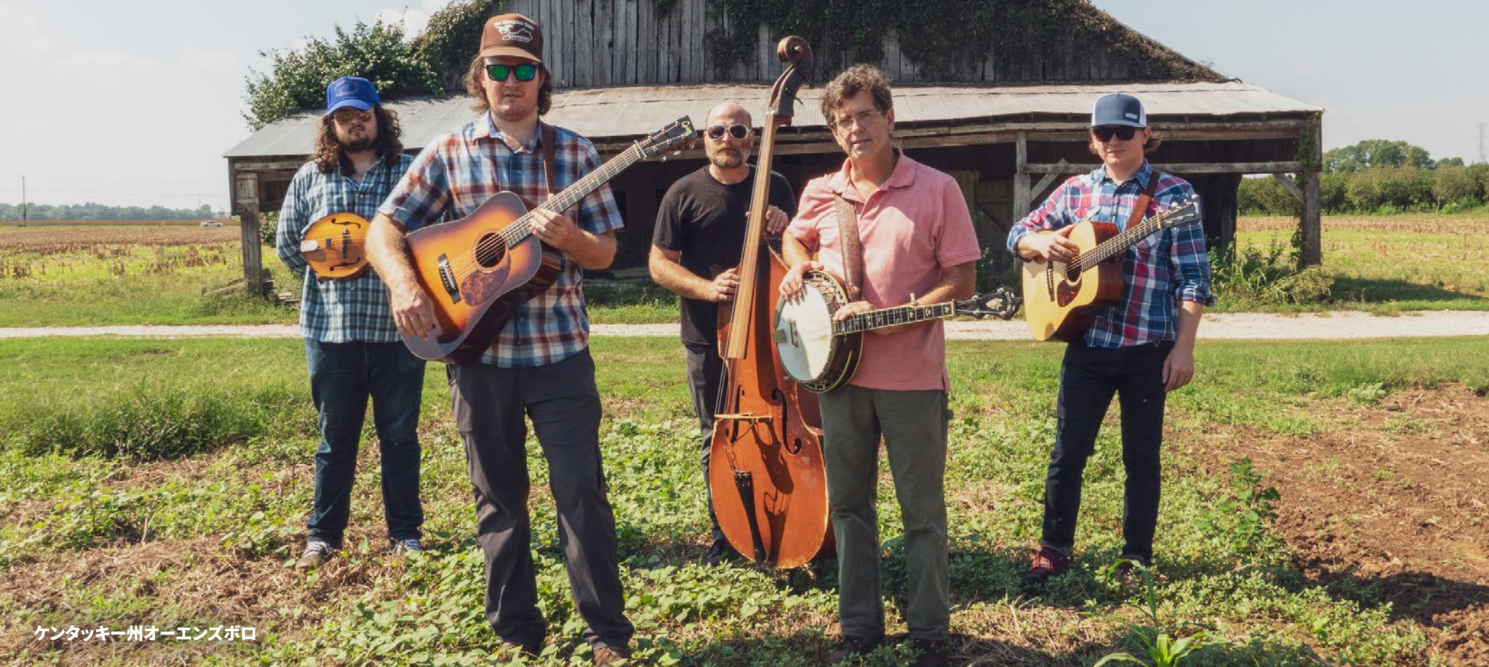
ケンタッキー州オーエンズボロ