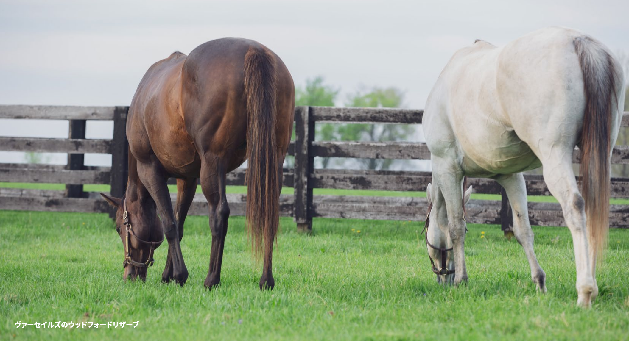
ヴァーセイルズのウッドフォードリザーブ