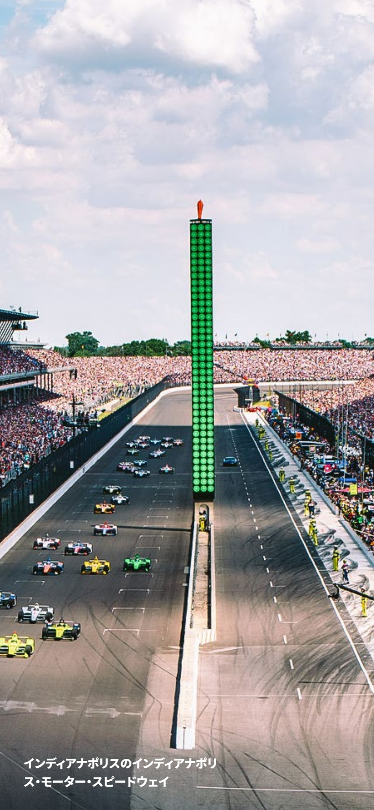
インディアナポリスのインディアナポリス・モーター・スピードウェイ