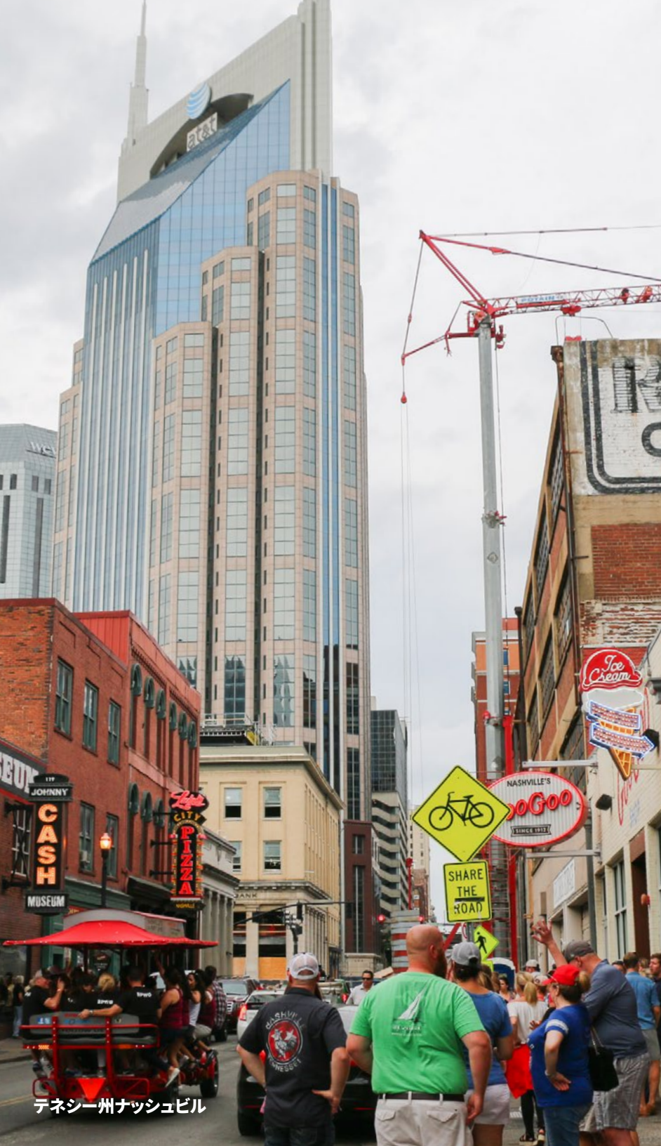
テネシー州ナッシュビル